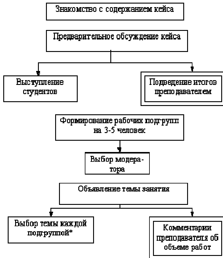
Стадия организации работы над кейсом

Последовательность организации и проведения занятий представлена на рисунках.